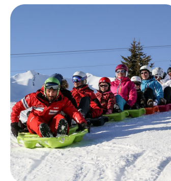
SNAKE GLISS POUR LES ENSEIGNANTS