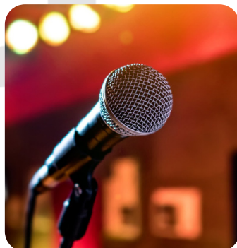
KARAOKÉ SUR ÉCRAN GÉANT