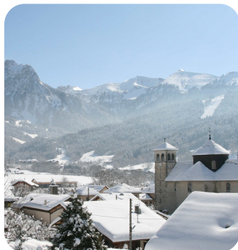
JEUX DE PISTES AVEC EXPLORATION DU VILLAGE

Voici une liste des activités non exhaustives que nous vous proposons. Nous pensons cependant qu'il est important d'organiser une réunion de coordination avec les enseignants qui seront sur place afin de mettre au point le programme qui correspond au mieux à leurs attentes. Un programme type vous est présenté mais qui peut évidemment encore évoluer. Nous souhaitons rester à l'écoute de votre groupe et répondre au mieux à vos attentes. Du matériel audio, informatique, platine DJ et projecteur avec écran géant sera mis à disposition du groupe tout le long du séjour.