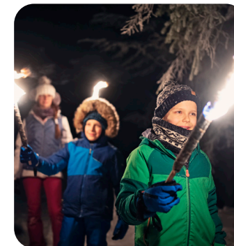
MARCHE AUX FLAMBEAUX