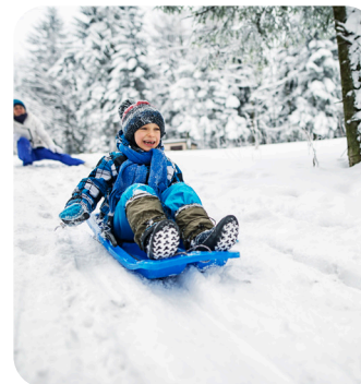
LUGE (SUPPLÉMENT 4€)