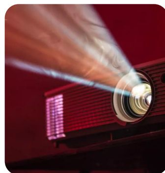
DIFFUSION DE VIDÉO