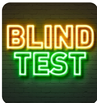
BLIND-TEST GÉANT ÉQUIPES D'ENFANTS & D'ENSEIGNANTS