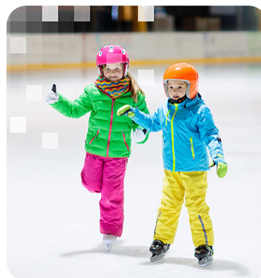
SOIRÉE PATINOIRE (SUPPLÉMENT 7€)