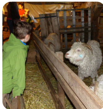
VISITE D'UNE FROMAGERIE ET CHÈVRERIE