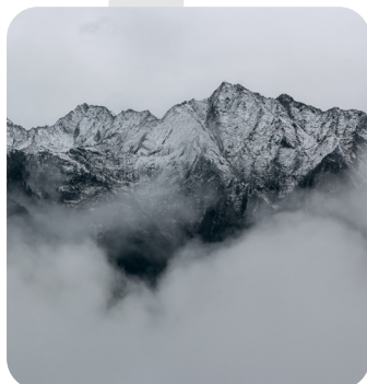
VISITE JEUX DE PISTE DANS EVIAN