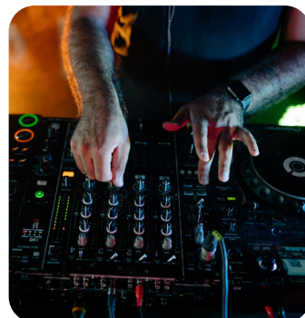
SOIRÉE DANSANTE AVEC DJ