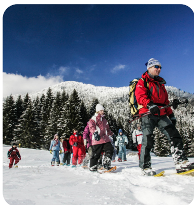
BALADE EN RAQUETTES (SUPPLÉMENT 4€)