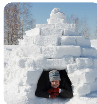
ATELIER SURVIE ET CONSTRUCTION D'UN IGLOO